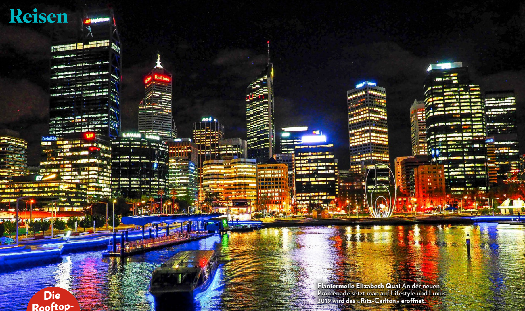
Flaniermeile Elizabeth Quay An der neuen Promenade setzt man auf Lifestyle und Luxus, 2019 wird das «Ritz-Carlton» eröffnet.