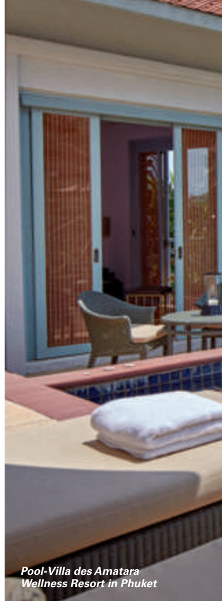
Pool-Villa des Amatara Wellness Resort in Phuket